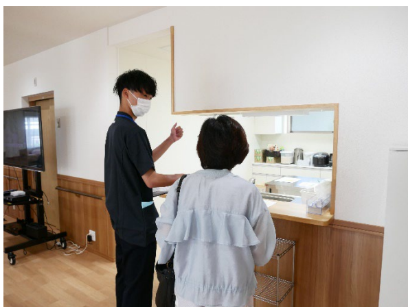
キッチンのご説明。