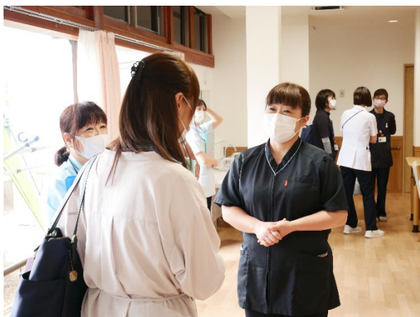
ケアマネに何でもご相談ください。