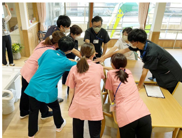
内覧会・オープンに向け、気合を入れるスタッフたち。

スタッフ一同、利用者さんが住み慣れた地域に住み続けられるよう取り組んでいきます。