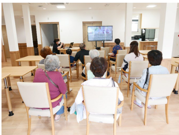
説明会ではご利用の詳細・イメージをお伝えしました。

先週末「小規模多機能型居宅介護 ひとい木」の内覧会を行いました。 暑い2日間でしたが、地域にお住まいの方、病院・介護事業所関係の方、たくさんの方にお越し いただきました。