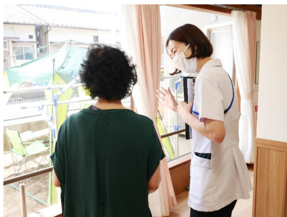
家庭菜園をする予定のお庭を案内。