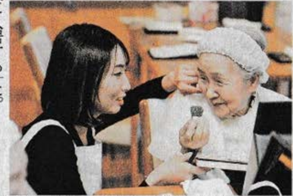
化粧をして笑顔を見せるお年寄り＝岐阜市福光東、福光グリーンホーム