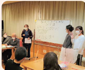
▲ デイケアアルバイト風景