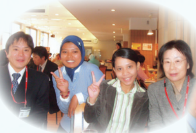
▲初めてのEPA受入れ(2008年)